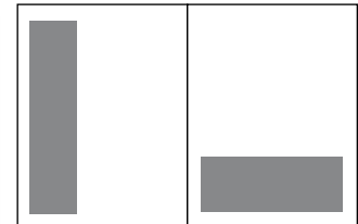
1/3 Seite hoch